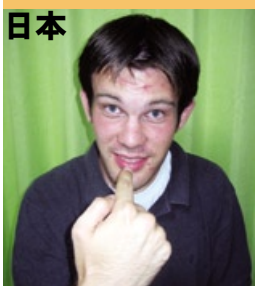
日本人の表現を見ると「はい、鼻ですね。風邪でもひいてるのかな…」と思うことも。