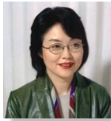
江川 紹子さんプロフィール

神奈川新聞記者を経て、フリーとなる。坂本弁護士一家の行方不明事件以来、オウム真理教を取材追求する。また、島原雲仙普賢岳の災害現場も取材するなど多方面で活躍。1996年には、編集者が選ぶ雑誌ジャーナリズム賞を受賞。現在、雑誌・新聞でコラムを連載中。また、テレビ番組等でコメンテーターを務める。