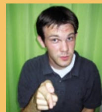
「これを戒めとしないさ」