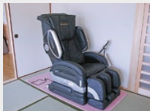
マッサージチェア1台