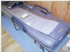
体固定式ローラー治療器1式