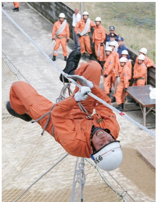
7月3日に伊予消防署で行われた伊予消防救助大会

※業者への依頼は、8:00～17:00の時間帯にお願いします。 ※水道メーターから宅地内側の修理は、すべて有料です。