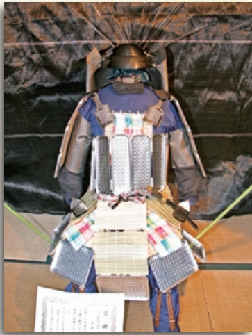
「百円ショップ」 作者：永井志朗さん(泉町四)