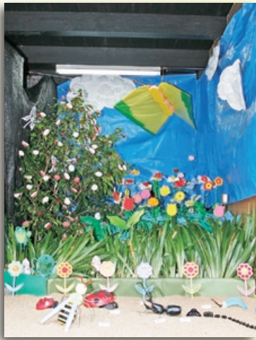
「花と虫たちのエコサミット」 作者：泉町三女性有志