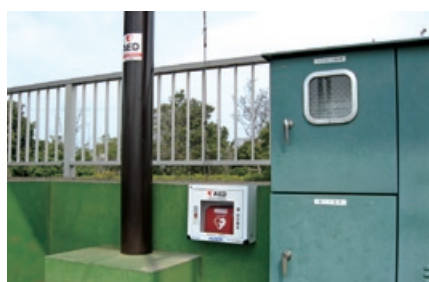
▲しおさい公園野球場のバックネット裏に設置されたAED