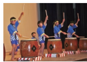
▶ 昨年の「いよし和太鼓のつどい(佐礼谷太鼓)」

地域の活性化につながればと、犬寄峠の周辺住民により結成されました。グループ名には地域で「おじさん・おばさん」になっても活動できるようにという思いが込められています。