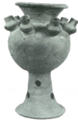
▼上三谷から出土した三角縁神獣鏡 ▶上三谷2号墳から出土した広口壺