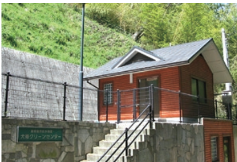
▲犬寄地区農業集落排水処理施設

公共下水道の処理区以外に、農業集落排水整備事業と浄化槽設置整備事業により、市内全域の下水道整備に取り組んでいます。農業集落排水整備事業については、大平処理区、佐礼谷処理区、犬寄処理区、源氏処理区が供用されています。