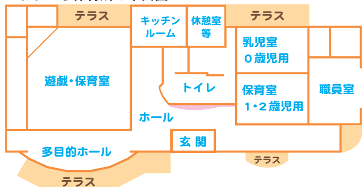
■おおひら保育所の平面図

保育所の入所について、入所要件を満たせば、大平地区の児童に限らず、市内すべての地域から入所できます。まずはお気軽にご相談ください。