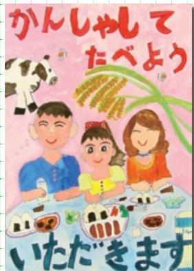
【入選】 坪内 萌さん(伊予小3年)