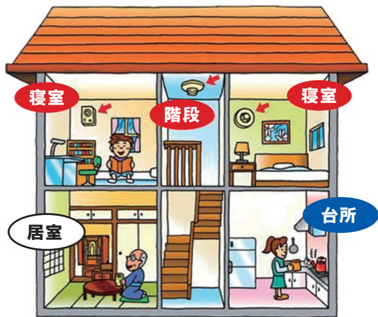
住宅用火災警報器の設置例

料理中に発生した大量の煙やくん煙式殺虫剤、風呂などから出る湯気によって、住宅用火災警報器が誤って鳴り出す場合があります。このようなときは、住宅用火災警報器のボタンを押すか、ひもを引っ張れば、簡単に音を止めることができます。