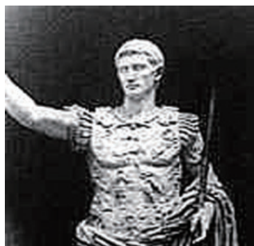
アウグストゥスの石像

から飛び降りてしまう人の為の大きな枕も使っていたそうです。救助マットの前身が当時すでに使われていたのですね。