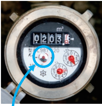
水道メーターの パイロットマーク