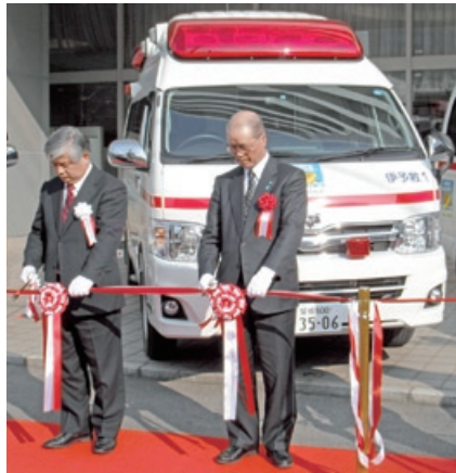
▲2月7日、JA愛媛で行われた贈呈式

2月7日、全国共済農業協同組合連合会愛媛県本部から伊予消防署に最新鋭の高規格救急車が寄贈されました。