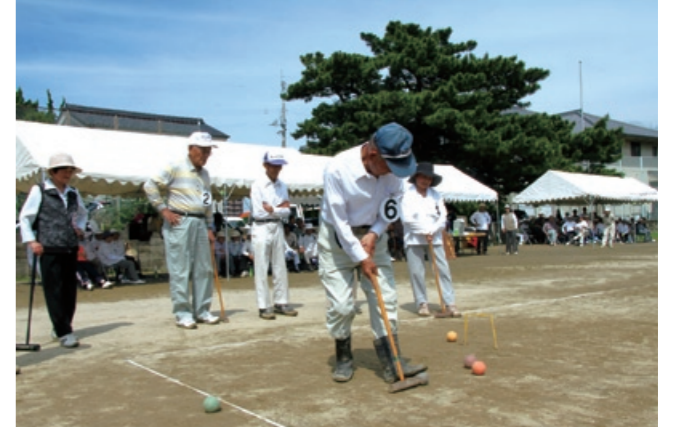
ク ロッカー大会 青空の下で楽しく交流を深めました

7月1日、JR松山～伊予長浜駅間で、『夕焼けビールトロッコ列車』が運行を始めました。伊予市駅でトロッコ列車に乗り換え、伊予灘に沈む夕日と爽やかな潮風を感じながら冷たい生ビールを飲むことができます。(要予約、8月27日まで) 伊予市駅でオープニングセレモニーが行われた後、伊予上灘駅では、上灘漁協女性部の方々が出迎え、じゃこ天や珍味を販売し、踊りや野球拳を披露しました。