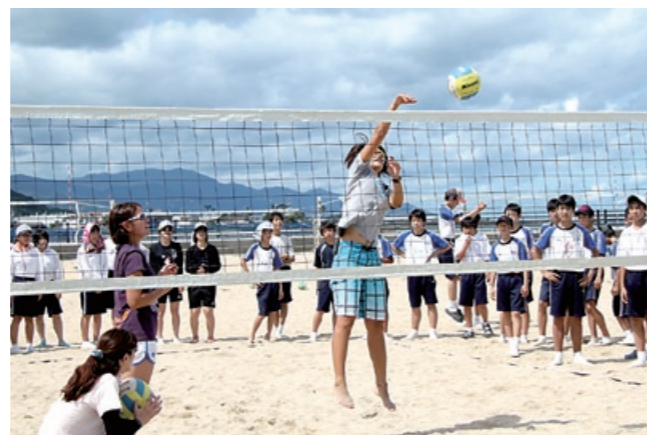
ビ 夢は大きくオリンピックの舞台 ーチバレークリニック

7月3日、ニンジニアスタジアムで『媛FC VS ファジアーノ岡山』(マッチシティ伊予市・西条市)が行われました。 スタジアム前ではマロンシャーベットやじゃこ天、海産加工品など伊予市自慢の特産品販売コーナーに多くのお客様が訪れました。また、伊予市サッカースクールと上灘少年サッカークラブの子どもたちが、エスコートキッズとして登場しました。