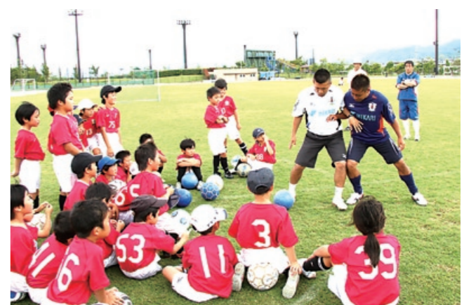
少 目指せJリーガー! 年サッカー教室