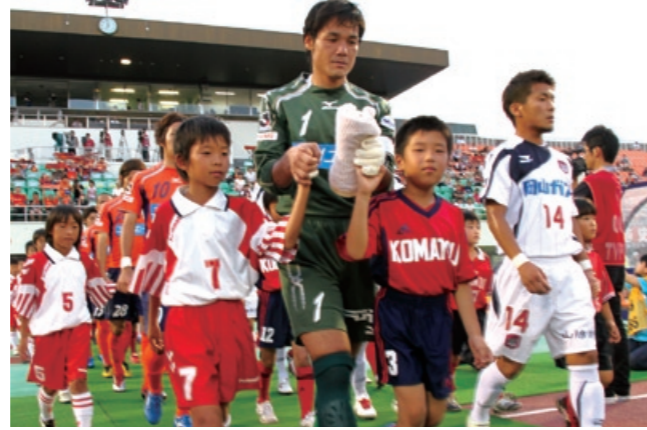
愛 憧れのJリーガーをピッチへエスコート 媛FC マッチシティ(伊予市・西条市の日)

春の叙勲・危険業務従事者叙勲・高齢者叙勲・内閣総理大臣感謝状 ご功労・ご功績に敬意を表し、晴れの受章(賞)をお喜びいたします