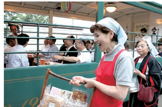
夕 沈む夕日と爽やかな潮風と共に 焼けビールトロッコ列車

6月26日、五色姫海浜公園とふたみシーサイド公園で今夏の海の安全を祈願する『海開き』が行われました。 五色姫海浜公園では、子どもたちが豊かな海になることを願い、ヒラメの稚魚の放流を行いました。 ふたみシーサイド公園では、由並小学校の児童によるふるさとの海に対する思いを込めた作文発表や沖縄琉球太鼓の演奏が行われました。 どちらの海もいよいよ夏本番を迎えます。