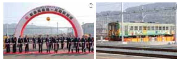
①2月2日、新車両基地・貨物駅等合同完成式典が行われ、地元住民や関係者らが完成を祝いました②車両基地内の転車台

辺地区が市町村制施行から昭和29年まで「南伊予村」であり、現在も地区内にある事業所の中にも名称が用いられています。地域住民だけでなく近隣住民にとっても北部の「北伊予」と対する地名として親しみを込めて呼ばれていることから命名されました。