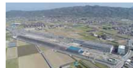
上空から見た車両基地・貨物駅周辺

3月14日(土)、北伊予駅と伊予横田駅の間に整備された南伊予駅が開業します。これにより、上下線合わせて53本の普通列車が停車し、松山・伊予市方面への通勤、通学の利便性の向上に期待が高まっています。 同駅は、県が実施するJR松山駅付近連続立体交差事業に伴い、上三谷と松前町鶴吉地区へ移転する車両基地・貨物駅の周辺整備事業の一環として地元要望を受けて整備されました。同駅には、70台が収容可能な駐輪場も整備されています。 駅名の「南伊予」は、駅周