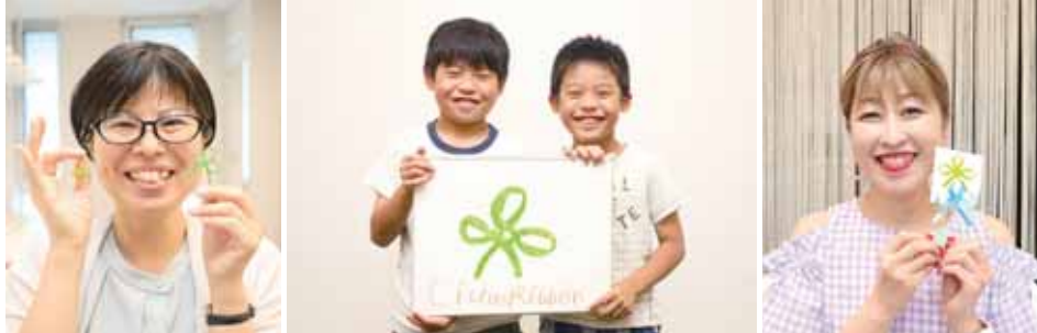
思いやりの輪が広がりますように