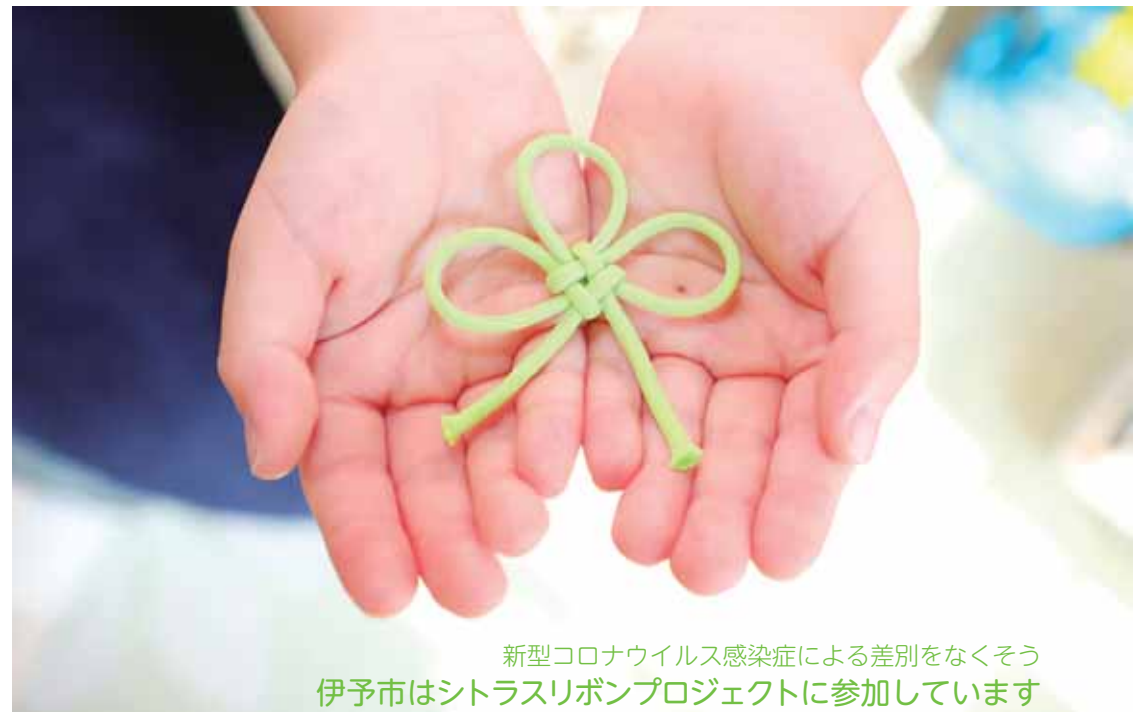
新型コロナウイルス感染症による差別をなくそう 伊予市はシトラスリボンプロジェクトに参加しています