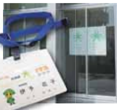
市庁舎へのポスターの掲示や職員の名札にシールを貼り意識を高めています

くて温かい人が多いまちだと感じています。このような温かなまちをウイルスによって壊されたくありません。これからも優しく暮らしやすいまちであり続けてほしいという願いを込めて、伊予市も「シトラスリボンプロジェクト」に参加しました。シトラスリボンの輪を広げて、みんなが地域に帰ってきたときに「ただいま」「おかえり」と言いあえる、思いやりがあふれる優しい地域を作りましょう。