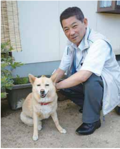
♥ さくら ちゃん 豆柴ミックス