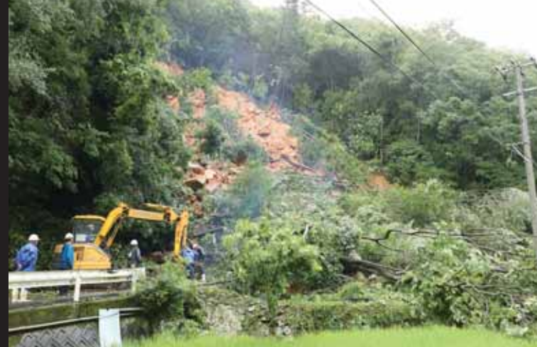
7月7日の豪雨により、唐川地区長崎谷集落へ向かう生活道を閉ざした土砂崩れ

大雨による土砂崩れや河川の氾濫など、災害が多いこの季節。通常の避難に加えて、新型コロナウイルスの感染防止対策も必要になってきます。新型コロナと災害から大切な命を守るためにどのような行動が必要なのでしょう。家族や知人、地域の人たちと話し合い、災害に備えましょう。