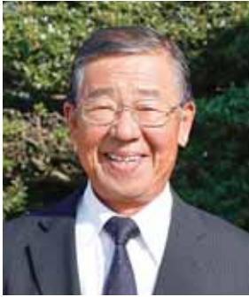
旭日双光章 (地方自治功労)