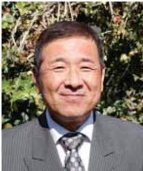
瑞宝双光章 (教育功労)