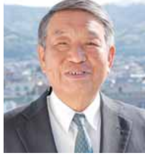
瑞宝小綬章 (地方自治功労)