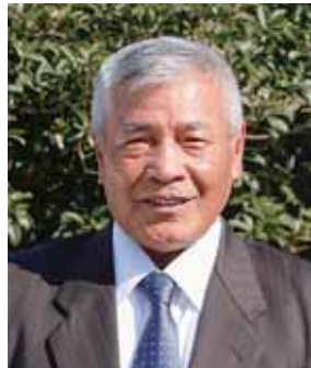
瑞宝単光章 (消防功労)