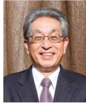
瑞宝小綬章 (地方自治功労)