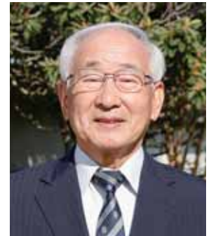
瑞宝双光章 (警察功労)