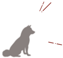
♠ コナンくん (柴犬)