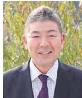
瑞宝双光章 (海上保安功労)