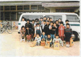
33,4年前の三秋集会所

この写真は今から三十四年くらゐ前の旧三秋集会所前撮った写真です。写っている子供達は、当時そろばんを習っていたメンバーです。昔は子供が多かったのですが、三秋だけでこんなにそろばんを習っていた人は、ここには写っていない人達は何人が地元に残っているのか？懐かしい一枚の写真です。