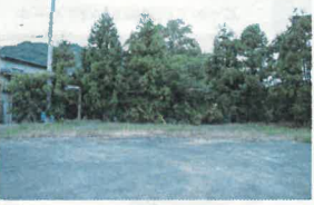
右の写真と同じ場所(現在)

この写真は今から三十四年くらゐ前の旧三秋集会所前撮った写真です。写っている子供達は、当時そろばんを習っていたメンバーです。昔は子供が多かったのですが、三秋だけでこんなにそろばんを習っていた人は、ここには写っていない人達は何人が地元に残っているのか？懐かしい一枚の写真です。