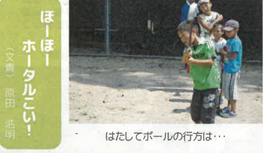
はたしてボールの行方は...