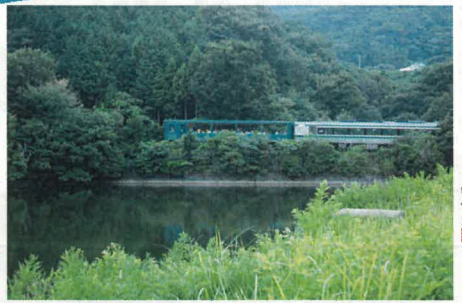
三秋大池とピールトロッコ列車(キハ32-501+キハ185系)