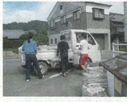
回収作業に勤しむ愛護班役員