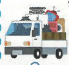
北山崎愛護班活動の一環として年3回の廃品回収があります。今年度、第1回廃品回収があり、三秋のた

くさんのご家庭の方々が協力して下さりました。回収は毎回、愛護班役員および会員の親御さん、子供たちで頑張っています。これからもご協力をお願いします。