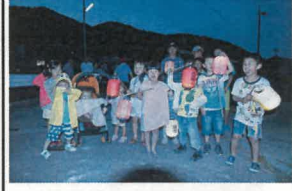
二本橋にて記念撮影ハイポーズ♪

り上がった大会でした。今回は、初回という事で、お試しの意味合いから、参加者を限定して行いましたが、2回目以降は、今回の経験を生かして、より多くの方に参加して頂けるような運営を目指してまいります。