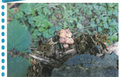
枯れかけてた杉の切り株から顔を出す小さな芽