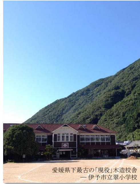
愛媛県下最古の「現役」木造校舎 — 伊予市立翠小学校

成田空港10:40発→松山空港12:40着のジェットスターで愛媛県に出発。昼食後、道後温泉など松山市内観光を経て伊予市双海町に入ります。宿泊施設に到着後、地域の皆さんとの交流プログラム(食事会)となります。翌日は保育所や小学校などの各施設や観光スポットを巡り、お子さまが各種グリーンツーリズム(農漁業体験)を楽しんでいるあいだに、町内の移住者用物件(空き家など)をご見学、また移住相談もおこないます。ご帰宅便は25日(日)、松山空港13:15発→成田空港14:45着となります。