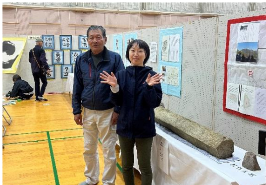
いよ市民総合文化祭