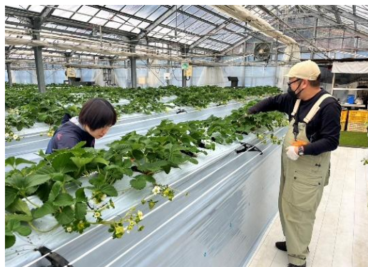
くぼなか農園お手伝い