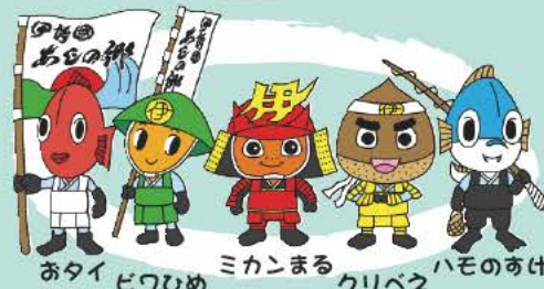
おたい びつひめ ミカンまる クリベえ ハモのすけ

「あじの郷五勇士」って聞いたことある? ご当地戦隊モノ? 最近ハヤリのゆるキャラ?? 伊予市が地域の魅力を広く伝えるために、市内の特産品をキャラクター化したのが、この「あじの郷五勇士」だ。ミカンまる、びつひめ、クリベえ、ハモのすけ、おたいの5人は、伊豫國(いよこく)に伝わる”伝説の食材”を探して旅に出た! P@CKTTO! では、これから5人が探し出す、魅力的な食の宝を追いかけていくよ!