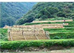
表紙撮影場所：中山町佐礼谷