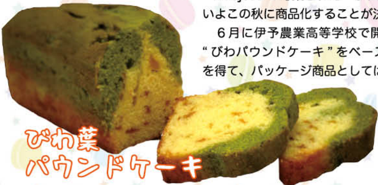
びわ葉 パウンドケーキ

6月に伊予農業高等学校で開催された試食会に出された“びわパウンドケーキ”をベースに、伊予鉄会館さんの協力を得て、パッケージ商品としては初の商品化となりました。