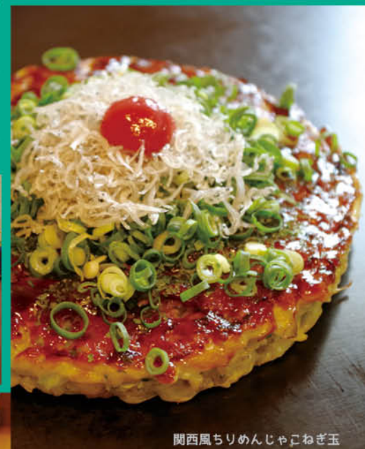
関西風ちりめんじゃこねぎ玉

▶お好み焼き料金+200円のランチセットには、ドリンクとデザートがついてきます。デザートは奥様の手作りです。季節によってピワや桃といった旬の食材を使っています。女子会やママさん会にもピッタリ!