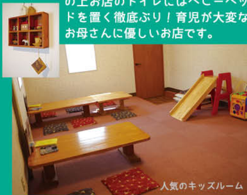
人気のキッズルーム

お店のコンセプトは「子ども連れでも落ち着いて食事ができるお店」です。店内には鉄板のないテーブルがあり、キッズルームも完備しているので、子どもを遊ばせながら安心して食事することができます。その上お店のトイレにはベビーベッドを置く徹底ぶり！育児が大変なお母さんに優しいお店です。