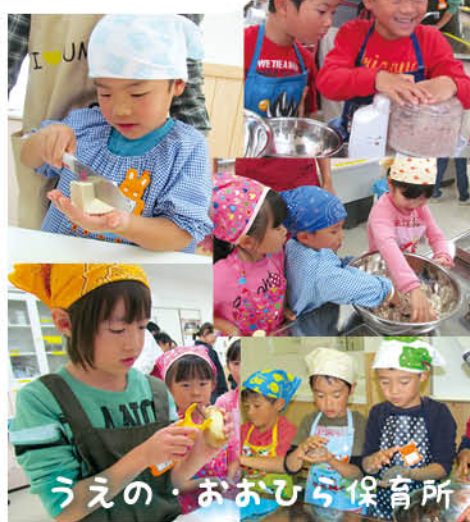
うえの・おおひら保育所

伊予農業高校 生産科学科・食品化学科 × 松山大学 農学部農産加工学 × 伊予市 伊予の郷づくり