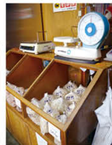
ムロアジ削り節 100g 380円