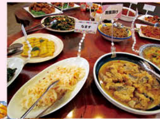
卵の花やきんぴらなど、家庭的なメニューが多く、落ち着いて食べられます。