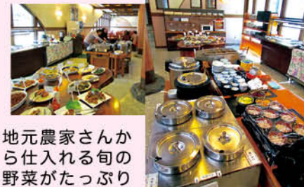
地元農家さんから仕入れる旬の野菜がたっぷりです。