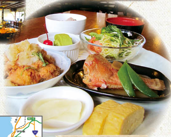
日替わりランチ 700円