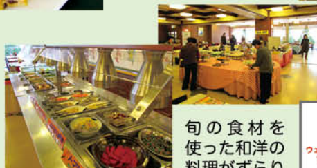
旬の食材を使った和洋の料理がざらりと並びます。