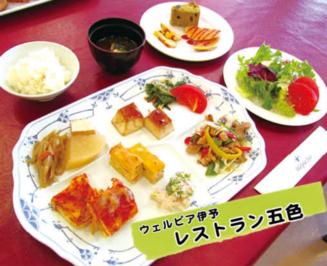
ウェルビア伊予 レストラン五色