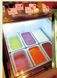
アイスやシフォンケーキ、ワッフルなどのスイーツも食べ放題で大満足！