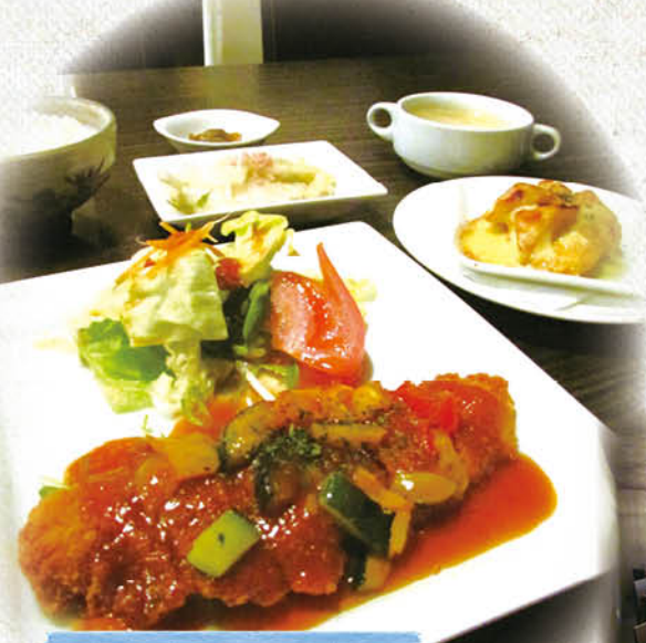
セレクトランチ 850円