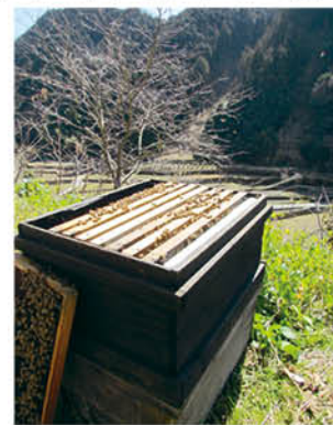
藤田養蜂場 〒799-3131 愛媛県伊予市大平甲739番地7 TEL/FAX 089-989-0225