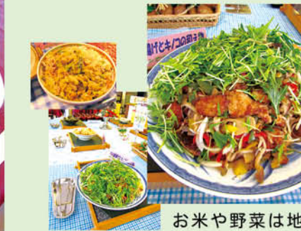
お米や野菜は地元の契約農家さんから届けられます。