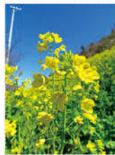
市の花: 菜の花 表紙撮影場所 / 双海町閨住地区