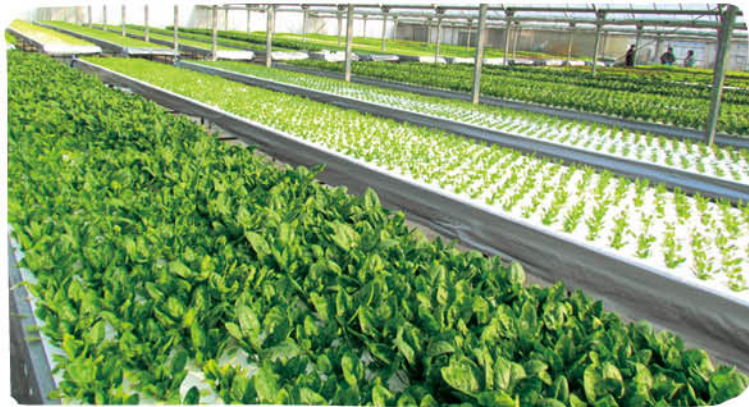
▲レタス・ミズナ・ホウレンソウなど、葉物野菜を中心に栽培されている。