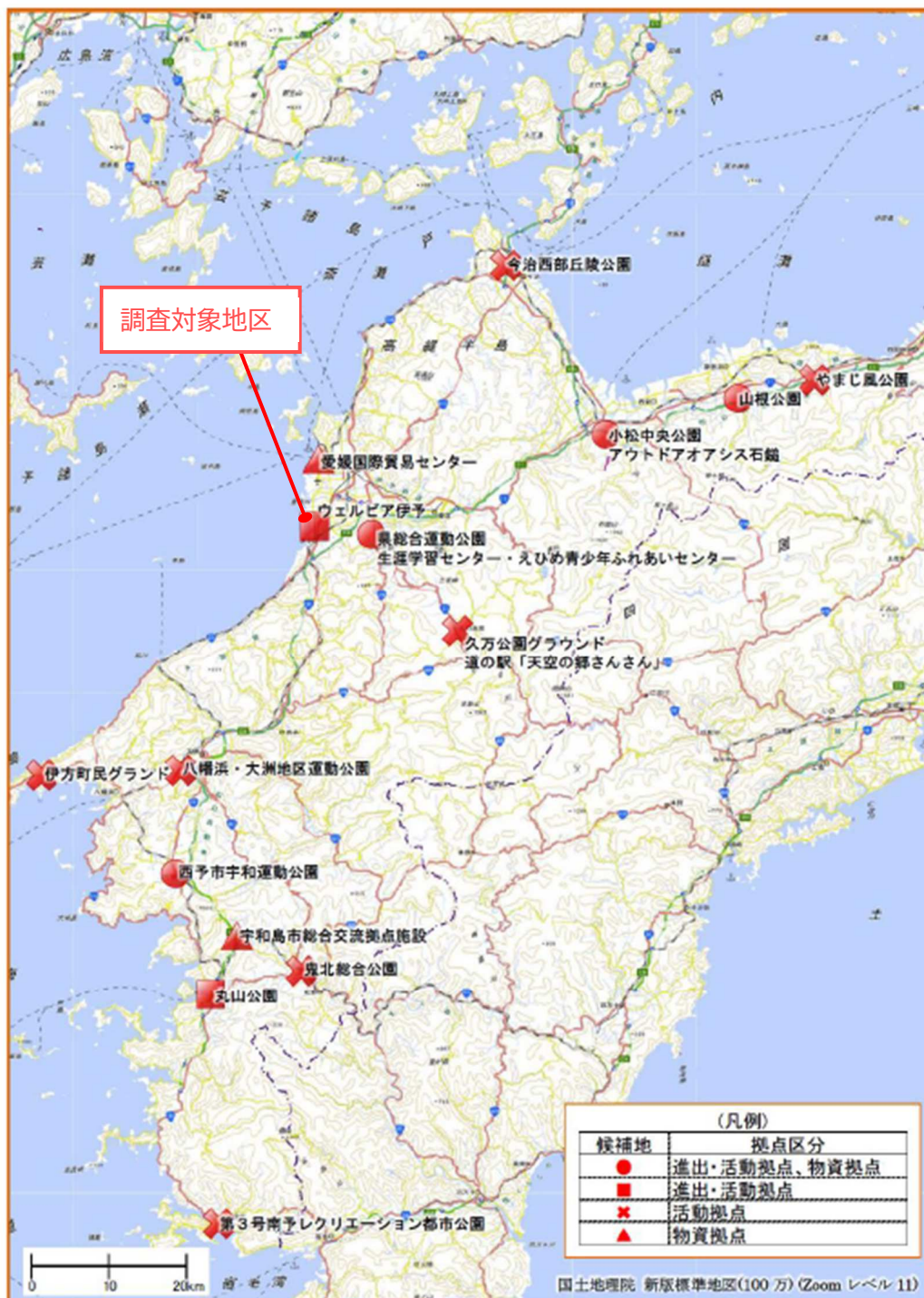
図 2-11 広域防災拠点位置図